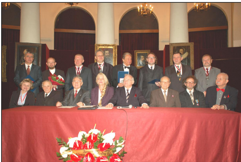
Udekorowani orderem Polonia Mater Nostra Est

Spółeczna Fundacja Pamięci Narodu i Kresowy Ruch Patriotyczny zaprosili nas na uroczystość dekoracji Orderem Polonia Mater Nostra Est osób szczególnie zasłużonych dla Polski.