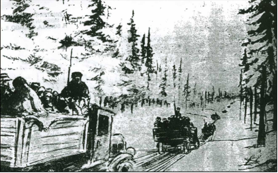
Transport samochodowy więźniów po drodze leśnej wybudowanej z drewna

Z Chicago, ze Związku Sybiraków otrzymaliśmy cykl rysunków przedstawiający katorżniczą pracę polskich zesłańców. Poniżej prezentujemy cztery prace.