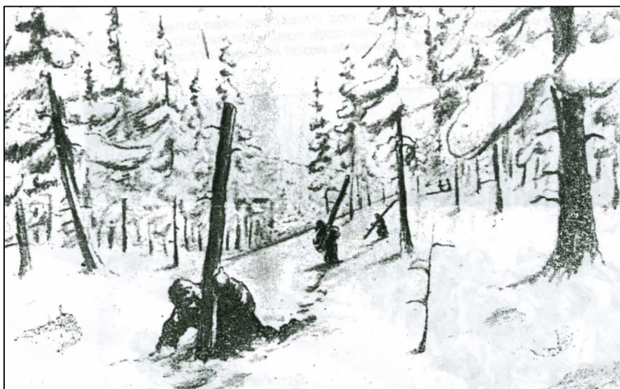
„Trajlowka” – rodzaj pracy polegającej na wynoszeniu drewna ku trasie kolejki leśnej