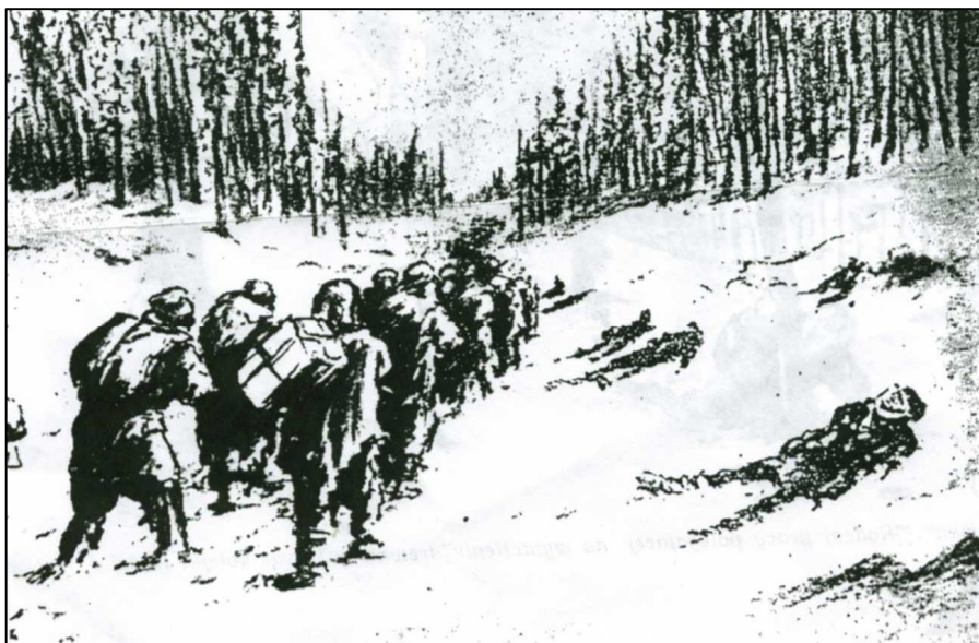
Karawana więźniów transportuje na plecach towary