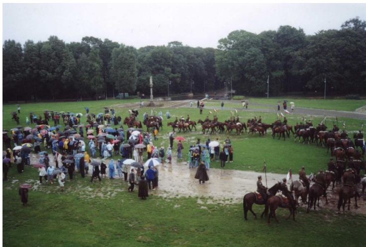
Wjazd I Konnej Pielgrzymki przed wały Klasztoru Jasnogórskiego. 29 VII 2000

żołnierze służby czynnej, rezerwiści, oraz żołnierze w stanie spoczynku, kombatan ci różnych formacji wojennych używali aktualnych stopni wojskowych wg nazewnictwa obowiązującego w kawalerii.