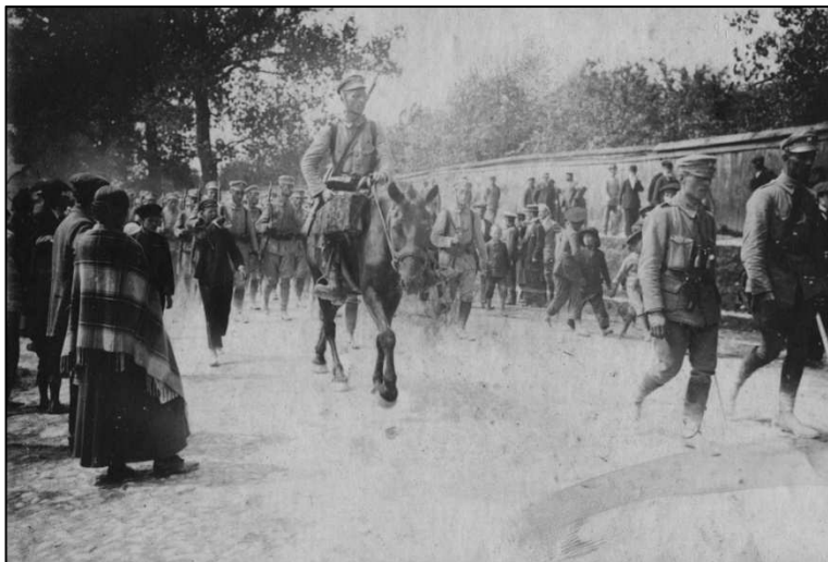
Pierwsza Kompania Kadrowa w Kielcach. 1914

Oddziały „Kadrówki” wkraczają do Kielc w Kongresówce. Dochodzi do starć z Rosjanami, ale społeczność kielecka od lat pogodzona z realiami zaborów reaguje apatią, obojętnością lub nawet wrogością.