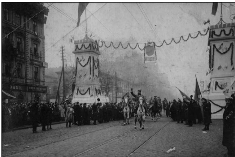
Wkroczenie Legionów Polskich do Warszawy.1916

Państwa centralne wydają tzw. Akt 5 Listopada. Cesarze Niemiec i Austro-Węgier deklarują, że z ziem Królestwa Polskiego, pozostających wcześniej we władaniu Rosjan, nastąpi powstanie państwa samodzielnego z dziedziczną monarchią i konstytucyjnym ustrojem . Uruchoмиło to swoistą licytację sprawy polskiej na arenie międzynarodowej.