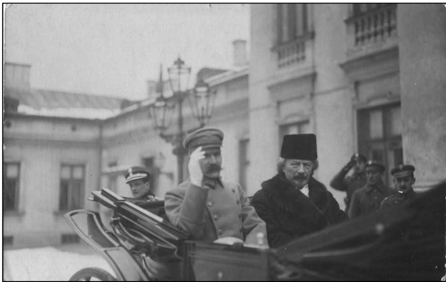
Józef Piłsudski i Ignacy Jan Paderewski. Warszawa 1919