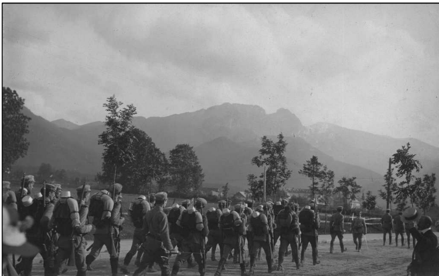
Oddział Związku Strzeleckiego w Zakopanem. 1913

w Krakowie powstaje bliźniacze Towarzystwo „Strzelec”, a w następnym Polskie Drużyny Strzeleckie (we Lwowie). Członkowie wszystkich trzech formacji współtworzyli po wybuchu wojny Legiony Polskie, stanowiące część armii austro-węgierskiej.