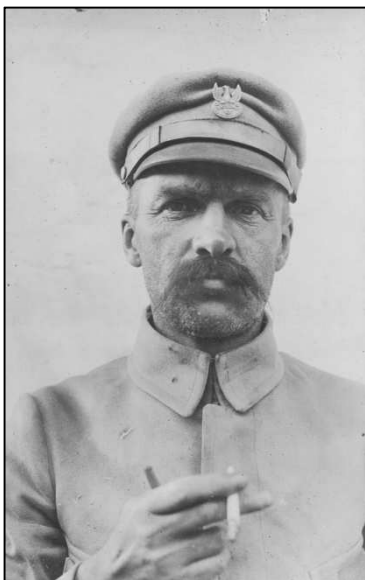
Brygadier Józef Piłsudski

Formalnie powstaje I Brygada Legionów Polskich (II oraz III Brygada utworzone zostają w maju 1915). Ponad miesiąc wcześniej Piłsudski, dowódca I Brygady, mianowany zostaje brygadierem, otrzymując tym samym swój pierwszy oficjalny stopień wojskowy.