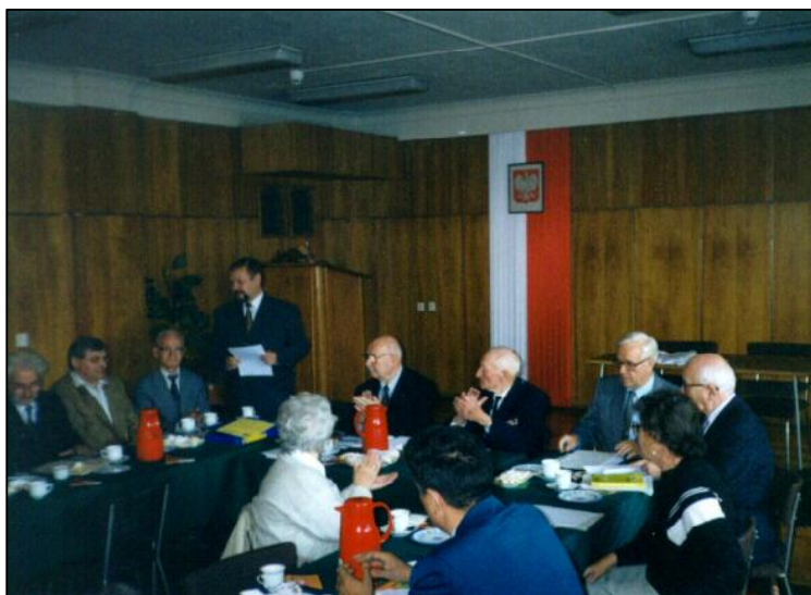
Pierwsze otwarte zebranie Stowarzyszenia. Na zdjęciu prezydium z zaproszonymi gośćmi

Kolejne spotkanie otwarte, połączone z tradycyjnym opłatkiem, zaplanowaliśmy na 5 grudnia o godz. 10.00, przy ul. Rakowieckiej 7.